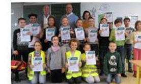
Juniorhelfer leisten Erste Hilfe