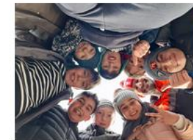
5. Klasse unterwegs